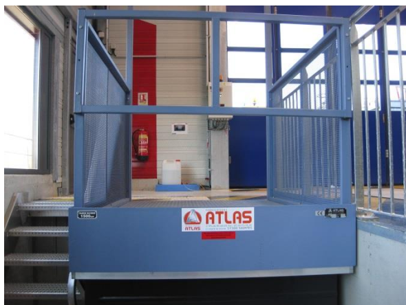
Exemple de monte-charge