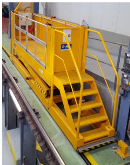
Exemple de plate-forme élévatrice mobile de personnes (Mobile sur rail)