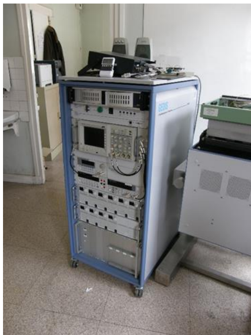
Exemple de testeur de carte électronique