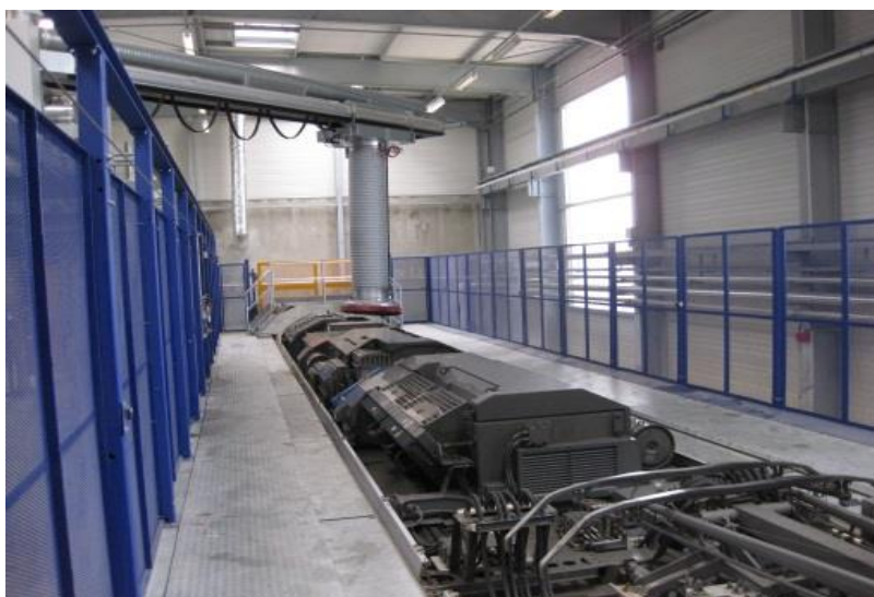
Exemple de passerelle d'accès toiture