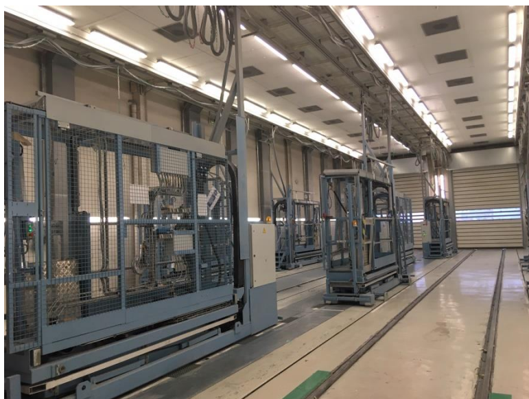
Exemple de cabine de ponçage