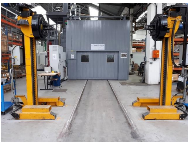
Exemple de machine à grenailler