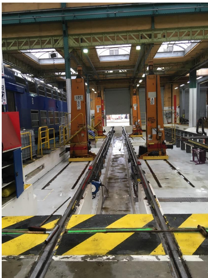
Exemple de chevalets de levage