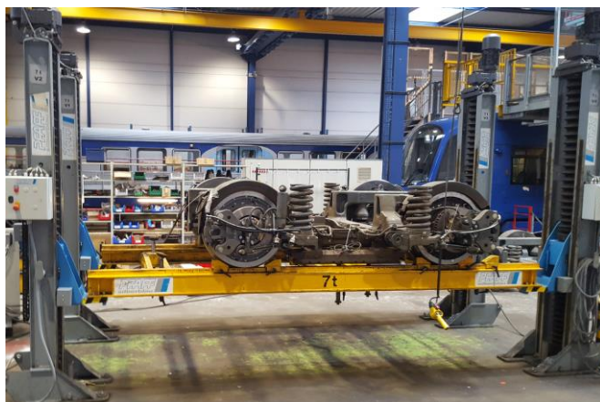
Exemple d'élévateur de bogie