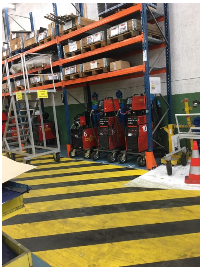
Exemple de postes à souder