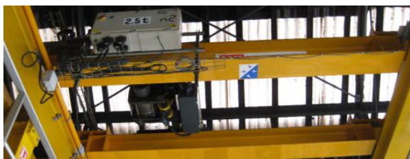
Exemple de pont