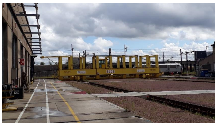
Exemple de chariot transbordeur