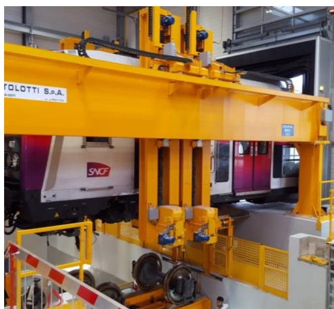
Exemple de vérin en fosse