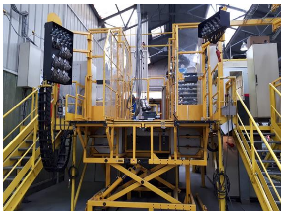
Exemple de banc d'essai remorques