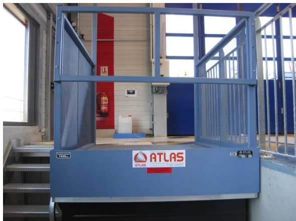
Exemple de monte-charge