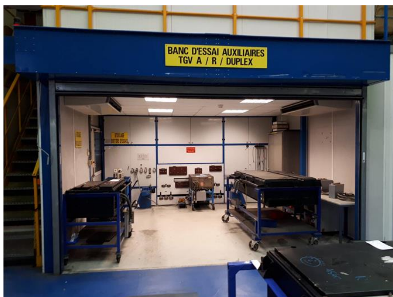
Exemple de banc onduleur TGV