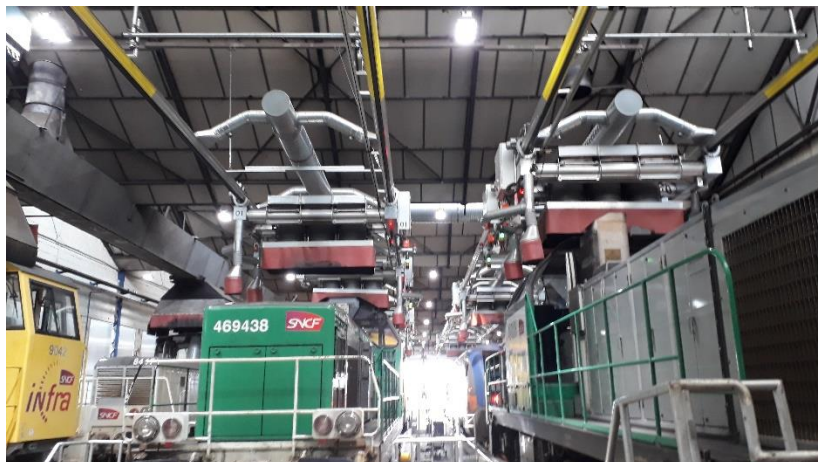
Exemple de hotte aspirante